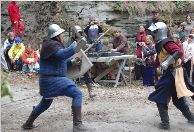
Vystoupení SHŠ Úpičtí střelci - Páni z Vízmburka, Vízmburské slavnosti 2008

Využijte tak jedinečnou příležitost a navštivte hrad Vízmburk, který byl nazýván podrkonoškými Pompeji.